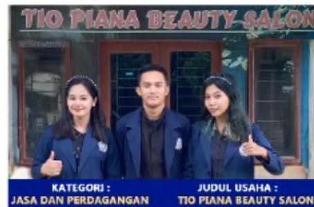
KATEGORI : JASA DAN PERDAGANGAN JUDUL USAHA : TIO PIANA BEAUTY SALON