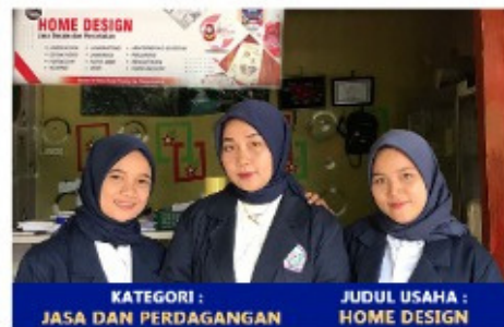
KATEGORI : JASA DAN PERDAGANGAN JUDUL USAHA : HOME DESIGN

✓ Mahasiswa/i Lolos Dana Hibah Program Pembinaan Mahasiswa Wirausaha ( P2MW )